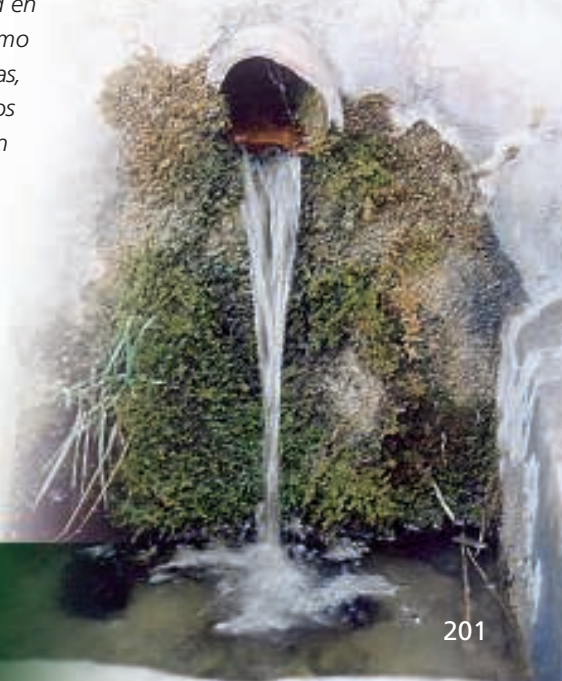
La fuente de la Rosa, manantial de aguas de calidad inmejorable, localizada en la Sierra de Enguera

En los montes de la Sierra de Enguera podemos encontrar la típica vegetación característica del bosque mediterráneo, con una gran variedad y originalidad en la flora, tanto pinos rodenos como carrascos y piñoneros, fresnos, carrascas, lentiscos, enebros, madroños, austeros robles valencianos, un gran volumen de plantas aromáticas y con propiedades medicinales, cornicabras, durillos, palmitos, etc. Este espacio natural alberga un madroño charral, tal vez el más grande del territorio valenciano, y el pino Romo, muy conocido por los habitantes de la zona. A su paso por senderos y caminos del interior podremos encontrarnos con una fauna muy