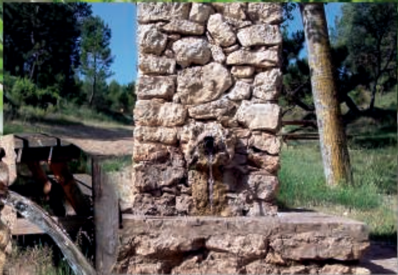
La Fuente Huesca.

La Fuente de la Rosa (a 970 mts. de altitud), es un manantial cuyas aguas son de una calidad inmejorable y abastecen el Campamento Juvenil "La Rosa", situado junto a la Cañada Real de Almansa y muy próximo a la confluencia de ésta con la Cañada Real de Tortosilla, catalogado por ello como abrevadero de uso público para el abastecimiento de los usuarios de la citada vía pecuaria. Se accede por el km. 24 de la carretera de Enguera a Ayora y posee instalaciones de acampada.