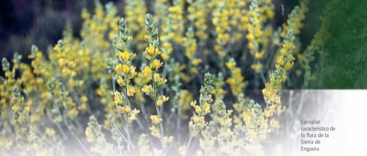
Ejemplar característico de la flora de la Sierra de Enguera

diversa: cabras hispánicas o montesas, jabalíes, zorros, gatos monteses, tejones, ardillas, jinetas, etc. búhos reales y siempre bajo la escrutadora mirada de águilas reales o perdiceras y otras rapaces que nos describirán círculos en un hermoso cielo azul. La Sociedad Española de Ornitología señala este enclave como un área importante para las aves.