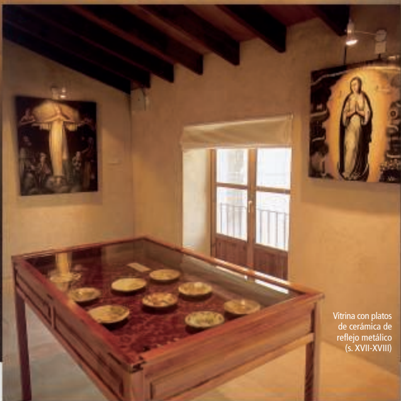
Vitrina con platos de cerámica de reflejo metálico (s. XVII-XVIII)