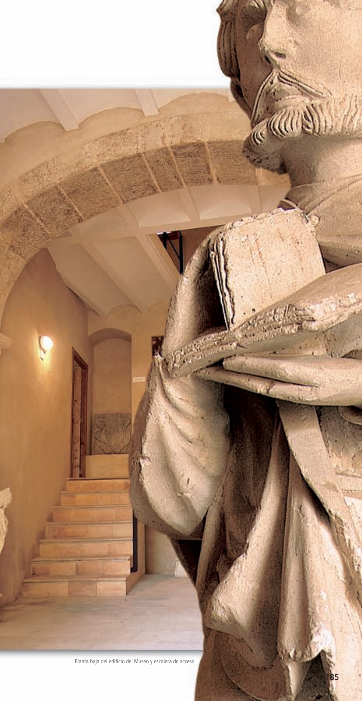
Planta baja del edificio del Museo y escalera de acceso