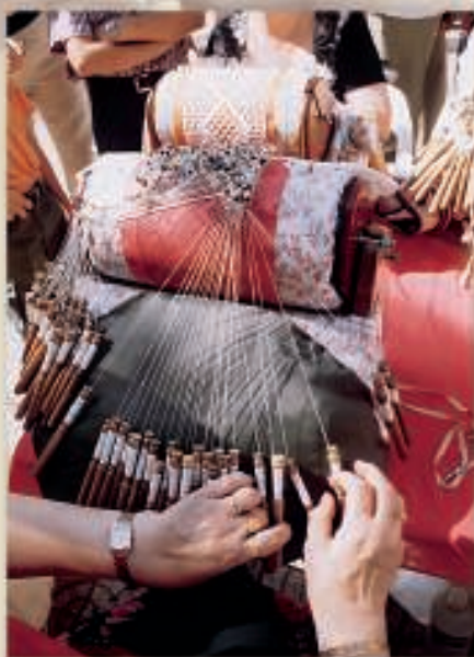
Confección de bolillos