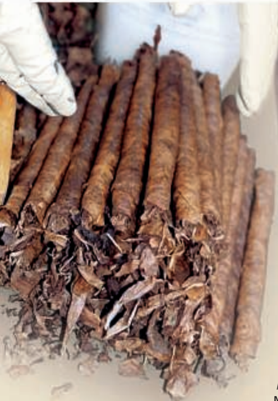
Elaboración de puros "Caliqueños"

La confección de la miel (Bolbaite, Navarrés, Bicorp, Quesa, Chella, Enguera, Dos Aguas, Antella) está catalogada en la zona del Caroig como producto artesanal. Asimismo se realizan trabajos de manualidades, pintura, cerámica, barro, etc. por parte de asociaciones de amas de casa muy activas (Bolbaite, La Font de la Figuera, etc.). También hay quesos frescos de servilleta y cazoleta elaborados de forma artesanal (Bolbaite).