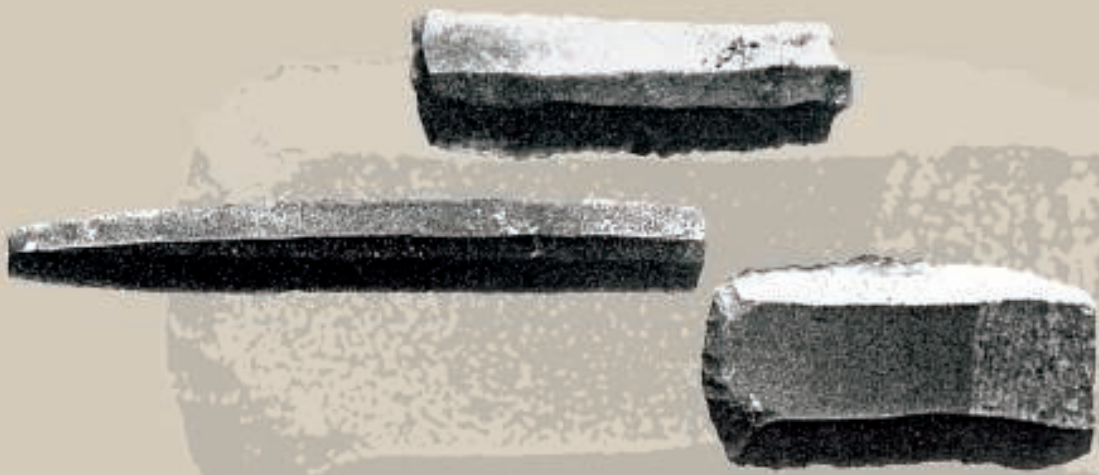
Cuchillos hallados en La Ereta

La mala conservación de la cerámica impide que se disponga de una adecuada tipología, y de formas y decoraciones que serían de gran utilidad, entre las que se cree que aparecerán las campaniformes desde el 2500 a. de C., como ya se han encontrado recientemente para niveles posteriores al 2000. Hacia el 2000 las defensas naturales se refuerzan con la construcción de una muralla o basamento pétreo de empalizada. La probable desecación del lago obligaron al abandono del lugar, ya que no ofrecía seguridades defensivas y desde el 2000 hay tendencia al encastillamiento, lo que se generaliza a partir del 1600 a. de C.